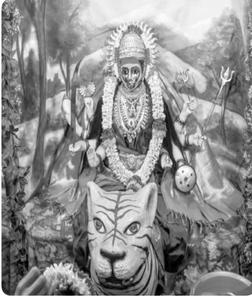
पुण्याची ग्रामदेवता श्री तांबडी जोगेश्वरी देवीची शुक्रवारी वाघजाई रूपात बांधलेली पूजा. शनिवारी नवरात्राच्या चौथ्या माळेला देवीची अश्वारूढ रूपातील पूजा बांधण्यात येईल, असे विश्वस्तांनी सांगितले .

दुसऱ्या बाजूने अरबी समुद्रात उठलेल्या लुबान वादळाची गतीही वाढली आहे, परंतु हे वादळ येमेनच्या दिशेने सरकले असल्याने भारताला त्याचा धोका नाही.