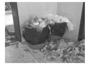
ससून रुग्णालयात पडलेला कचरा

स्वच्छतागृहांची अवस्था ही फार वाईट आहे. स्वच्छतागृहांचे दरवाजे तुटलेले आहेत. स्वच्छतागृहाजवळच रुग्णांनी काढून टाकलेली बॅडेजेस व इतर साहित्य टाकले जाते. तसेच शिकाऊ डॉक्टर रुग्णांचे म्हणणे नीट ऐकून घेत नाहीत. बराच वेळ रुग्णांना ताटकळत ठेवले जाते. कधी कधी संपलेलं सलाईन काढण्यासाठी हातात बाटली