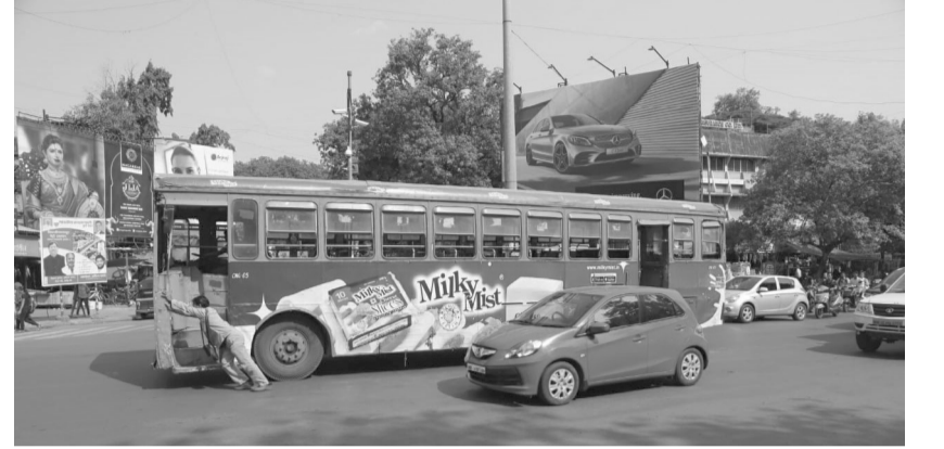
दे धक्का : गोखले चौकात बंद पडलेली बस

पुणे, ता. १३ : ऐन रहदारीच्या रस्त्यावर बंद पडलेल्या बसमुळे वाहतुकीचा खोळंबा झाल्याचे अनेकदा दिसून येते. बंद पडलेल्या या बसला प्रवासी धक्का देतात असे चित्र शहरातील रस्त्यावर हमखास दिसते. पीएमपीएमएलच्या गाड्यांची ही दुरवस्था कायमच चिंतेचा आणि टीकेचा विषय ठरत आहे,